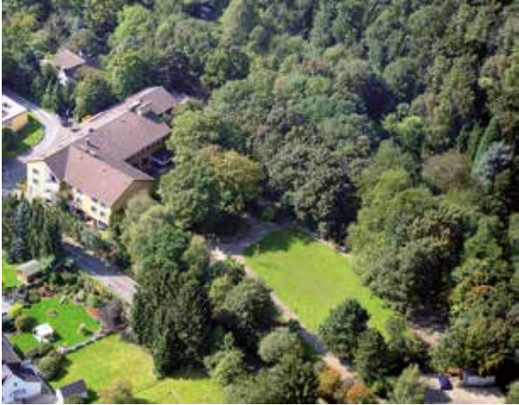
Haus am Turm

Ev. Bildungswerk Essen III. Hagen 39 45127 Essen